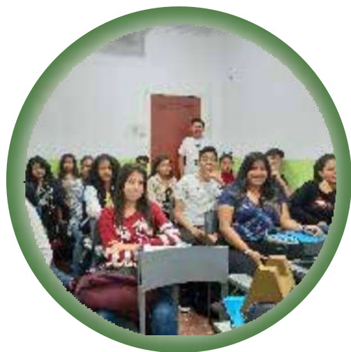
Ingreso a la Universidad